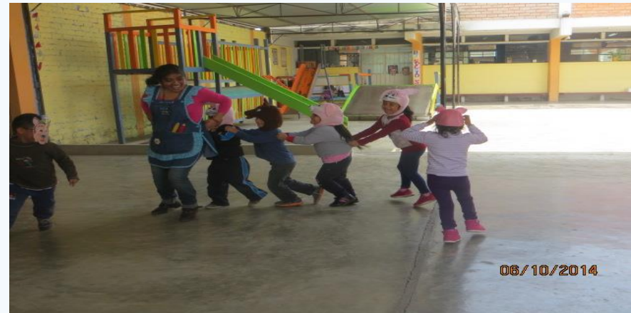
IEI 105 "Yoy Marina Garate"