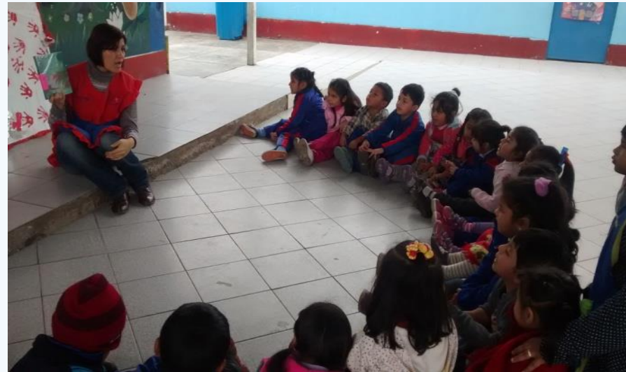
IEI 057 "Pasitos de Jesus"