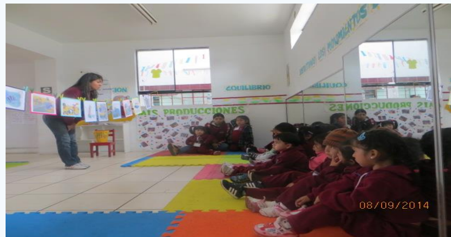
IEI Vitrina 115-10 "Mundo del Saber"

Fortalecer las capacidades de las directores y docentes del nivel inicial de la UGEL 05 en la elaboración de las sesiones de aprendizaje.