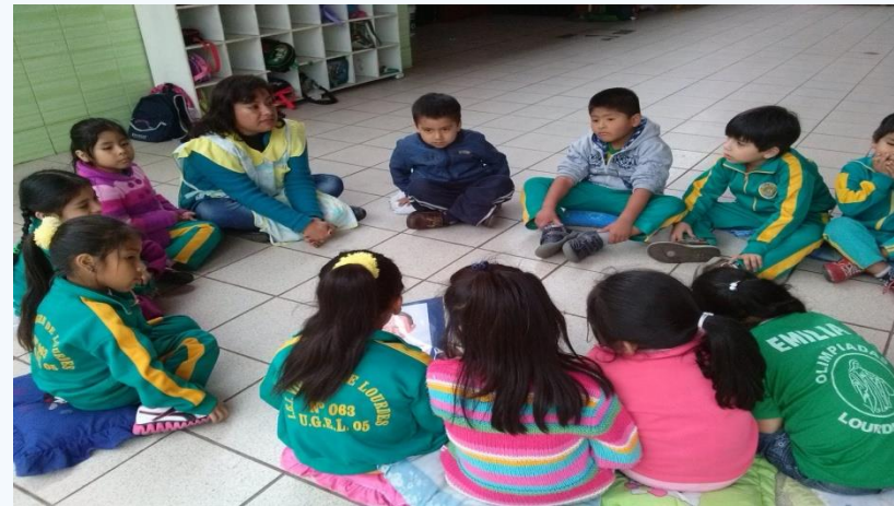
IEI Vitrina 063 "Virgen de Lourdes"

Diseñar sesiones de aprendizaje de Matemática, Comunicación y Ciencia y Tecnología.