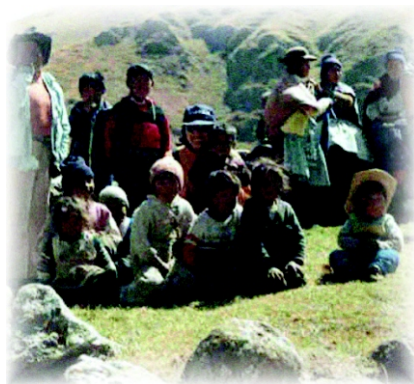
Comunidad de Rumichaca - Huancavelica

Las Instituciones Educativas Unidocentes, procederán a constituir su Consejo Educativo Institucional normalmente como cualquier Institución Educativa, es decir reconocen a los integrantes: Director - Docente, un representante de los padres de familia, una autoridad comunal, un representante de alumnos, un representante de ex alumnos, si fuera el caso, y un representante de los pobladores elegido por la comunidad .