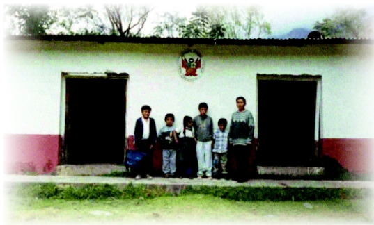
Institución Educativa Unidocente Vitis - Yauyos