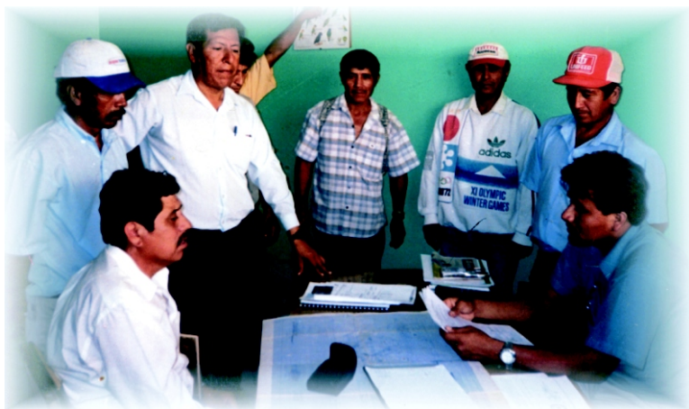
El Director de la Institución Educativa Niño Jesús de Praga, reunido con los integrantes del CEI para realizar acciones de vigilancia.

Las funciones del CEI expresados en la participación, concertación y vigilancia ciudadana están orientadas a fortalecer las capacidades de gestión de la Institución Educativa, para mejorar prioritariamente los niveles de aprendizajes de los alumnos y el clima institucional; de conformidad con la visión, misión y experiencias valorativas previstas en el Proyecto Educativo Institucional y articuladas con el Plan Anual de Trabajo, el Reglamento Interno, el Proyecto Curricular de Centro y demás instrumentos de gestión.