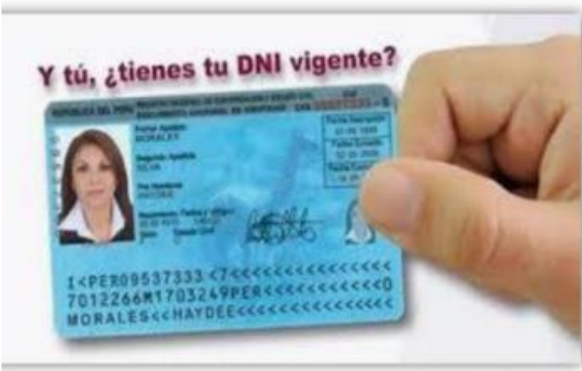
AMBOS LADOS DEL DNI