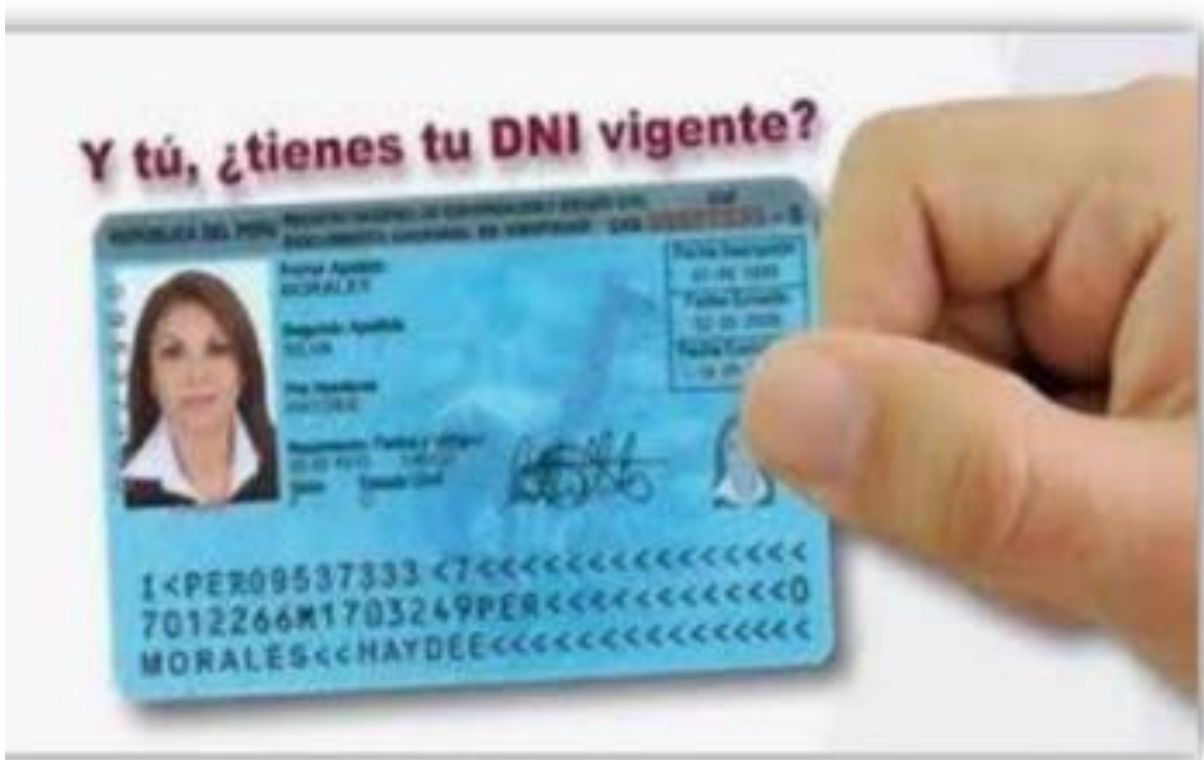
AMBOS LADOS DEL DNI